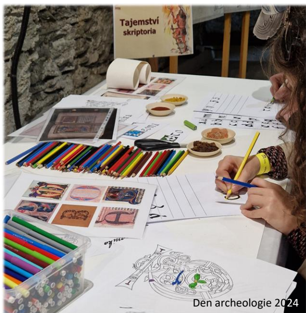
Den archeologie 2024

Krátce se ještě ohlédneme za akcí den archeologie, která proběhla v říjnu na zámku Bruntál. Téma pro rok 2024 bylo Umění v čase a návštěvníci tak měli možnost dozvědět se mnoho zajímavostí o umění v pravěku či středověku. Během odpoledne probíhaly i tematické workshopy, při kterých si zájemci vyzkoušeli kouzlo kaligrafického písma, či tetovací metodu handpoke, praktikovanou již od pravěku! Všem ještě jednou moc děkujeme za návštěvu. Již nyní pro vás připravujeme letošní ročník, který bude trochu jiný, ale ještě o kousek lepší. Tak se uvidíme 4. října 2025.