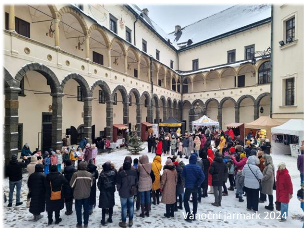
Vánoční jarmark 2024