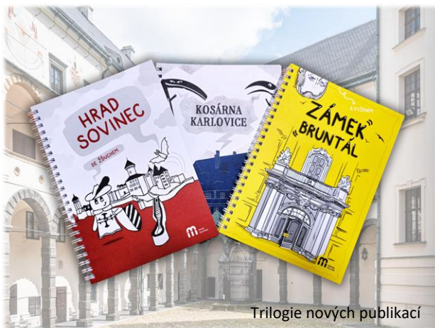
Trilogie nových publikací

Nové publikace jsou tedy částečně knihami ke čtení a částečně zábavnými luštitelskými časopisy, takže vždy nabídnou odpočinek od vašich každodenních starostí. Vedle toho samozřejmě budou představovat zajímavý suvenýr, kterým můžete potěšit sebe nebo své blízké. Svě výtisky si můžete zakoupit na objektech našeho muzea.