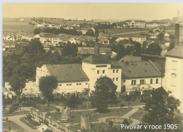
Pivovar v roce 1905

Zámecký park, který dnes láká návštěvníky svou jedinečnou atmosférou, se v průběhu času výrazně proměnil. Jeho současnou dominantou je sala terrena, která je využívána jako místo k odpočinku a kulturnímu vyžití. Sál v zahradě, jak zní český překlad názvu stavby, nebyl vždy součástí zámeckého areálu a jeho vznik úzce souvisí s přestavbami na počátku 20. století.