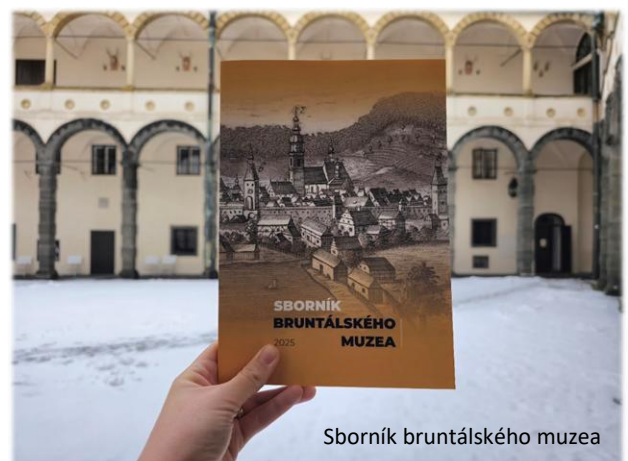
Sborník bruntálského muzea