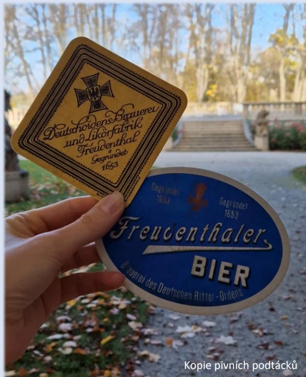
Kopie pivních podtácků

Ve sbírkách Muzea v Bruntále se nachází několik artefaktů, které připomínají existenci a provoz bruntálského panského pivovaru. Mimo pivních lahví, vývěsního štítu nebo množství dobových fotografií pivovarské budovy se dochovaly i pivní podtácky s řádovou tematikou. Jejich novodobé kopie jsou k zakoupení v prodejně bruntálského zámku.