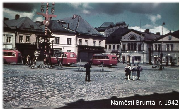
Náměstí Bruntál r. 1942

Výstavu si budete moci prohlédnout v malé výstavní síni Muzea v Bruntále od 13. 2. do 1. 6. 2025.