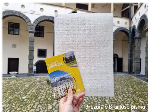
Brožura v Braillově písmu

Zámek Bruntál, významná kulturní památka regionu, se i nadále snaží o to, aby byl přístupný všem. Nově tak mohou historii tohoto jedinečného místa poznat i nevidomí a slabozrací návštěvníci díky zcela nové brožuře v Braillově písmu. Ta obsahuje popis nejvýznamnějších míst zámku, informace o jeho historii a zajímavosti, které by neměly uniknout žádnému návštěvníkovi. K zapůjčení je zdarma na zámku Bruntál.