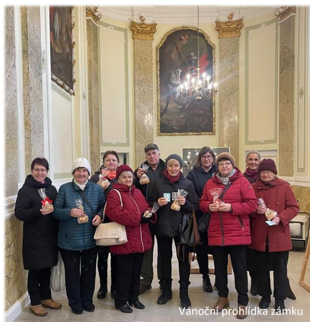
Vánoční prohlídka zámku

Podle výrazů a ohlasů samotných seniorů bylo zřejmé, že si den opravdu užili. Jejich nadšení a radost nám potvrdily, že tato akce měla smysl. Mnozí vyjádřili svou vděčnost za krásný zážitek.