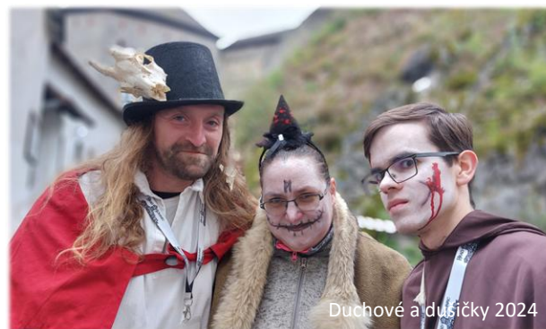
Duchové a dušičky 2024

Nechyběl ani netradiční hradní rébus doplněný o vyřešení záhadné hradní vraždy. Zkrátka ta správná duchařská atmosféra panovala na každém kroku. Tak zase za rok.